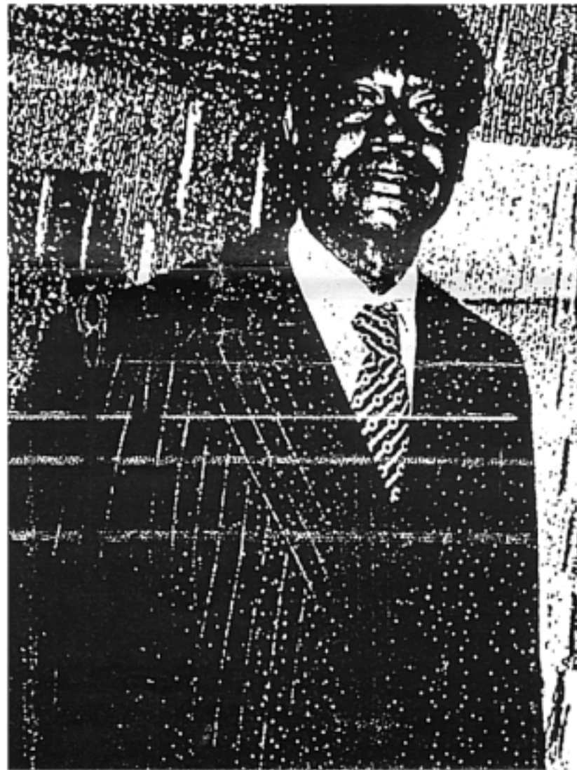
Pr. K. de BANA

LE PR. K. BANA TRACE LE CHEMIN DE L'INDEPENDANCE DU CAMEROUN ET LES MOMENTS MOUVEMENTES DE L'UPC