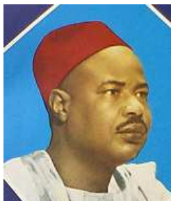
Ahmadou Ahidjo, Premier Président du Cameroun, contraint les nationalistes au silence. Mais à quel prix ?

Pour illustration, rien ne prédisposait la Côte d'Ivoire et le Congo ex-Zaïre aux crises politiques qu'ils ont connues ces dernières années, après des décennies de stabilité. La Libye nonobstant le système anti-démocratique qui y règne, n'a rien à envier au Benin, Mali, Ghana, Nigeria, etc. meilleures démocraties d'Afrique et pareillement stables. Autant l'histoire du Cameroun rappelle à ses nombreux lecteurs qu'en vingt ans, soit de 1955 en 1975, ce pays a souffert d'une guerre civile qui a décimé toute une tribu. Les méthodes de dissuasion utilisées par le jeune Etat (voir image ci-dessus) soutenu par la France, furent des plus atroces et pareillement suffisantes pour s'imposer.