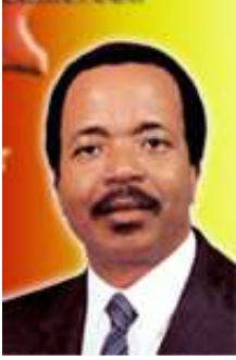
Paul BIYA, De la rigueur à la Peur ?

Ce qui précède traduit à quel point le repli identitaire d'un groupe minoritaire vilipendé et incompris peut remettre en question la paix générale dans un pays. D'ailleurs l'émergence du Pangermanisme doit son socle en grande partie aux frustrations subies par les allemands après la 1 ère Guerre Mondiale. Et nous connaissons ce que cette folie idéologique a causé à toute l'humanité. Autant de références qui guident notre raisonnement en nous interpellant autour des indices qui expriment le malaise dans lequel baignent certains de nos compatriotes. Pour illustration :