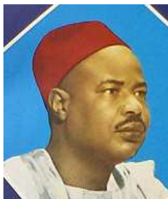
Ahmadou Ahidjo, Premier Président du Cameroun, contraint les nationalistes au silence. Mais à quel prix ?

Pour illustration, rien ne prédisposait la Côte d'Ivoire et le Congo ex-Zaïre aux crises politiques qu'ils ont connues ces dernières années, après des décennies de stabilité. La Libye nonobstant le système anti-démocratique qui y règne, n'a rien à envier au Benin, Mali, Ghana, Nigeria, etc. meilleures démocraties d'Afrique et pareillement stables. Autant l'histoire du Cameroun rappelle à ses nombreux lecteurs qu'en vingt ans, soit de 1955 en 1975, ce pays a souffert d'une guerre civile qui a décimé toute une tribu. Les méthodes de dissuasion utilisées par le jeune Etat (voir image ci-dessus) soutenu par la France, furent des plus atroces et pareillement suffisantes pour s'imposer.